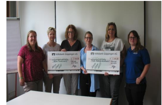
Spendenübergabe ökumenische Ostereieraktion